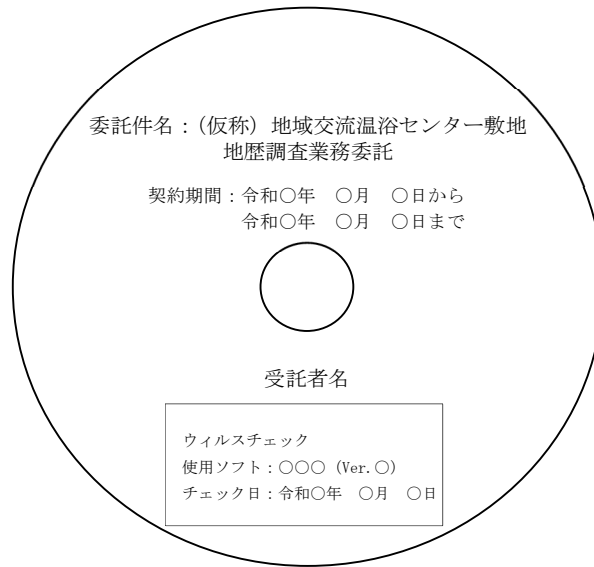
メディアへの印字例

(3) 土壤汚染対策法第4条第1項及び県条例に基づき提出する図書 前記(1)と同様な簿冊の型式で、正副各1部を作成する。