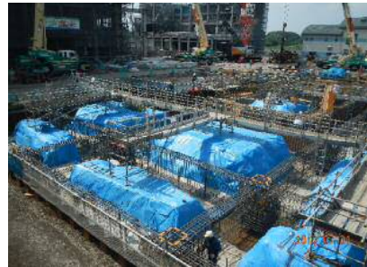
H29年7月 駐車場棟基礎工事状況