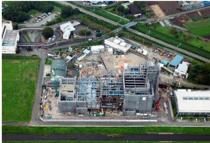
全景 H29年9月末 撮影