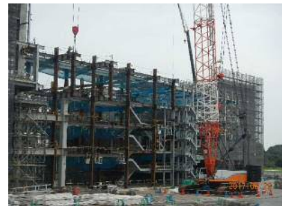
H29年8月 鉄骨建て方状況