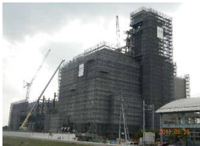
H29年8月 外装工事状況