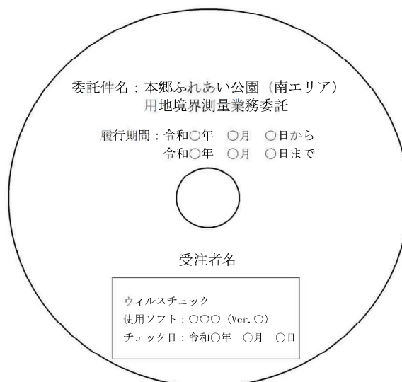
メディアへの印字例